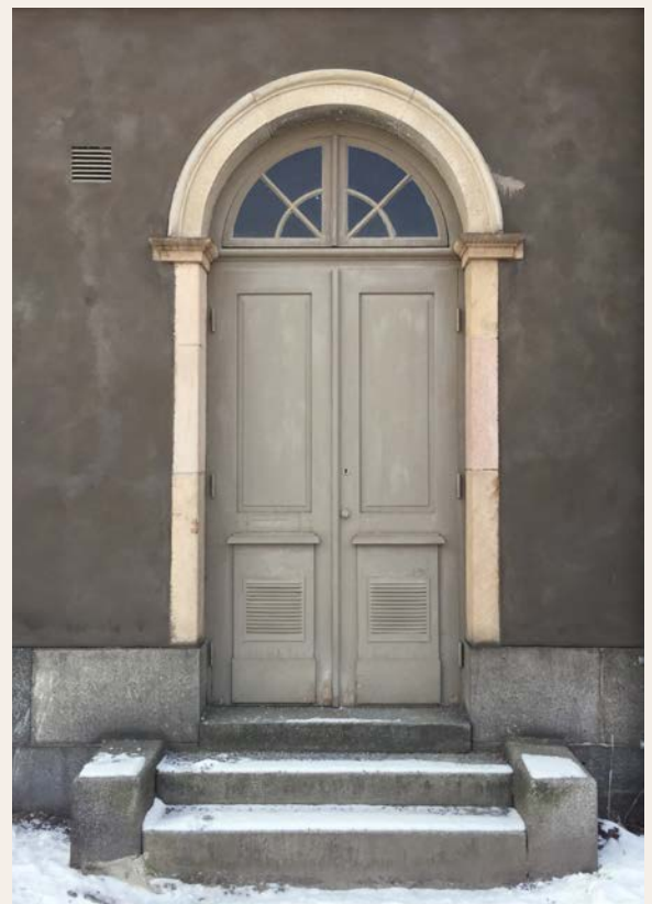
Port i kasernbyggnaden, 2018.

Mer info: www.kkh.se/education/restaureringskonst